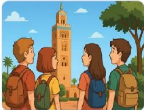
Devant la koutoubia

C'est absolument magnifique, pensent les touristes devant la majesté de la Koutoubia