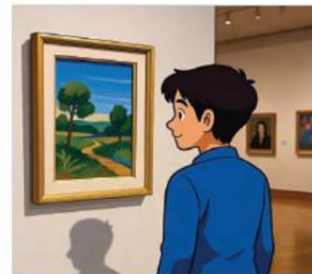
Une œuvre d'art