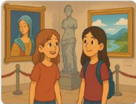
Visite dans un musée