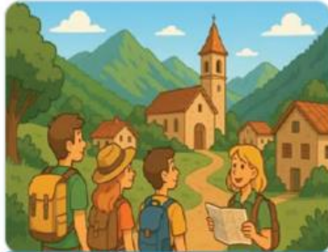
Journée calme dans un petit village

C'est absolument magnifique, pensent les touristes devant la majesté de la Koutoubia