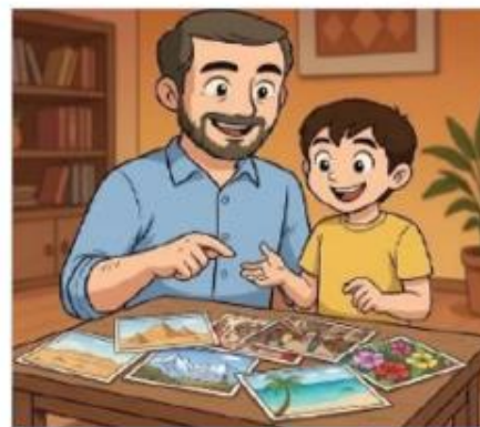
Photos prises lors d'un voyage

Je suis à Rabat... Je visite la Tour Hassan avec mes amis. Je ne m'attendais pas à voir un monument aussi beau !