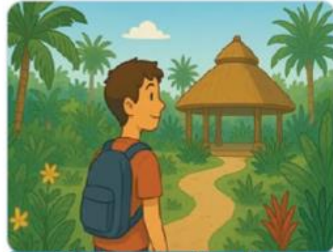
Visite aux Jardins exotiques

J'ai beaucoup aimé cette journée passée dans ce petit village.