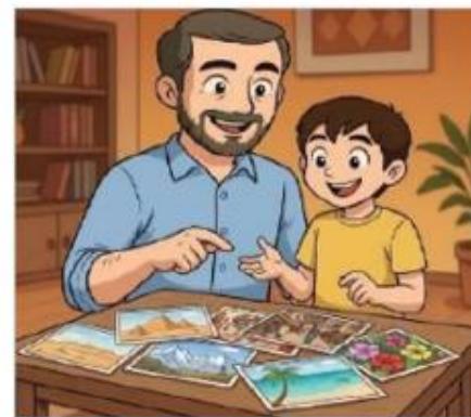
Photos prises lors d'un voyage