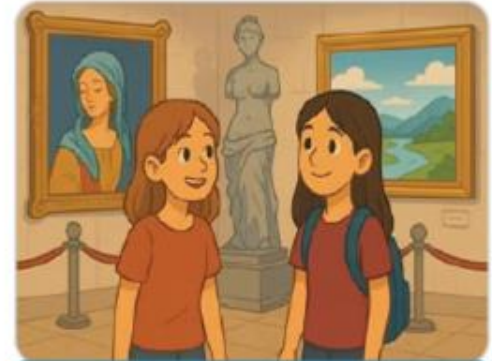
Visite dans un musée

Je ne m'attendais pas à passer des moments aussi agréables aux jardins exotiques